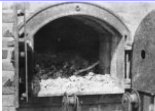
Majdanek (KL Lublin) nach der Befreiung 1944. Das Innere eines Krematoriumsofens mit verbrannten menschlichen Überresten.