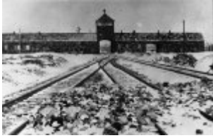
Das Eingangstor zum KL Auschwitz-Birkenau; Januar 1945