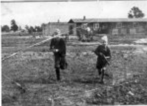
Die ältesten Söhne von Max Pauly, Kommandant von KL Stutthof, beim Spaß auf dem Gelände des Lagers; wahrscheinlich 1942.