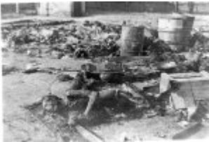
Übergangslager Żabikowo b. Poznan - Körper der von den Deutschen erschossenen und verbrannten Gefangenen während der Evakuierung des Lagers; Januar 1945, nach der Befreiung des Lagers.