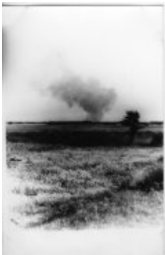
Das Vernichtungslager Treblinka - in der Ferne ist der Rauch über dem Lager sichtbar.