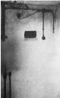
Majdanek (KL Lublin) - ein Raum vor einer Gaskammer mit einer Einrichtung zum Einschalten der Gasflasche. Das Fenster an der Wand erlaubte das Betrachten der Vergasung.