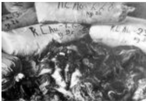
Ein Haufen von Säcken mit Haaren von in KL Auschwitz-Birkenau ermordeten Frauen. Die Haare wurden von den Deutschen verpackt und für den Versand zum industriellen Einsatz vorbereitet; 1945, nach der Befreiung des Lagers.