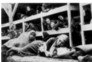
Auschwitz-Birkenau - Gefangene in der Baracke; 1945