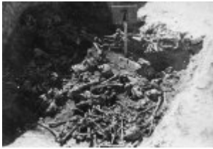
Eines der Gräber, die während der Exhumierung in Majdanek (KL Lublin) aufgedeckt wurden; Herbst 1944