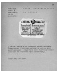
Ein Schild mit einer Aufschrift in deutscher und polnischer Sprache mit dem Hinweis auf ein Fotografieverbot unter Androhung der Erschießung. Schilder mit diesem Inhalt wurden an den Zäunen der Konzentrationslager angebracht. Ein Schild mit einer Aufschrift in deutscher und polnischer Sprache mit dem Hinweis auf ein Fotografieverbot unter Androhung der Erschießung. Schilder mit diesem Inhalt wurden an den Zäunen der Konzentrationslager angebracht. Den Deutschen war daran gelegen, dass Informationen über die Konzentrationslager nicht an die Öffentlichkeit gelangen. (AIPN)