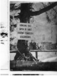
Stutthof - Fichte, auf der Gefangenen erhängt wurden; in der zweiten Hälfte der vierziger Jahre. (AIPN)