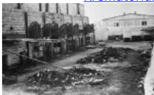
Majdanek (KL Lublin) - die Überreste von verkohlten Leichen neben den Krematoriumsofen; Juli 1944, nach der Befreiung des Lagers.