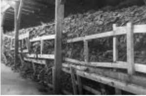
Majdanek (KL Lublin) – ein Haufen von Schuhen in einer der Baracken; Juli 1944, nach der Befreiung des Lagers.