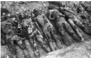
Majdanek (KL Lublin) – ausgegrabene Leichen von Häftlingen; August 1944