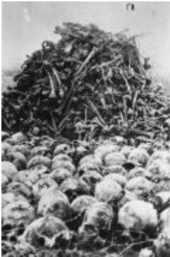
Majdanek (KL Lublin) - Schädel und Knochen der Opfer, die während der Exhumierung ausgegraben wurden; Herbst 1944