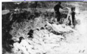
Massenhinrichtung in Stutthof.