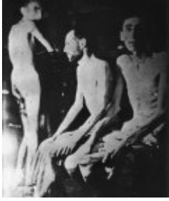
KL Buchenwald - niewolnicy III Rzeszy - wygłodzeni więźniowie; kwiecień 1945 r. po wyzwoleniu obozu. (IPN)