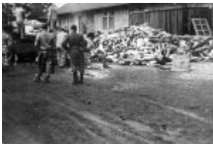
KL Dachau - Gefangene tragen die Körper der Ermordeten von der Plattform, im Hintergrund das Krematorium; 1945