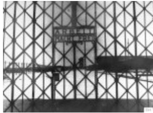
Tor zum KL Dachau mit der Aufschrift „Arbeit macht frei“.