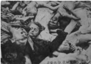
KL Dachau - Leichen der ermordeten Häftlinge; April 1945, nach der Befreiung des Lagers.