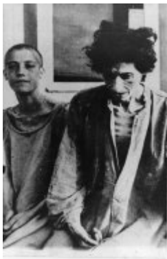
KL Ravensbrück Gefangene; 1945, nach der Befreiung des Lagers.